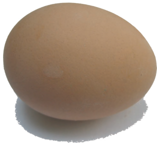
fig. 6. oeuf.

Je n'ai plus besoin que de n'être pas seul. Les soirs de solitude, je lis jusqu'à épuisement. Me réveillant parfois dans la nuit, je suis contraint de reprendre ma lecture.