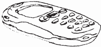
fig. 5. téléphone portable.