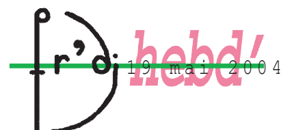
fig. 8. ambition.

Je n'ai plus besoin que de n'être pas seul. Les soirs de solitude, je lis jusqu'à épuisement. Me réveillant parfois dans la nuit, je suis contraint de reprendre ma lecture.