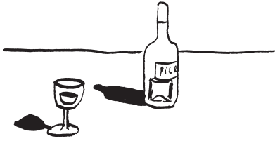
fig. 1. apéro.

Boire son apéro tout les soirs, ou se bourrer la gueule une fois par mois, ou bien les deux?