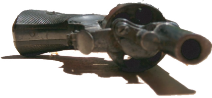
fig. 4. violence.