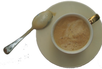
fig. 2. café.

Tout ce qui stimule les zones érogènes du cerveau est susceptible de devenir une drogue. Cependant, à mon sens, la dépendance est dans l'excès.